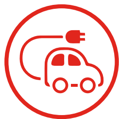
PREVENCIÓN Y MOVILIDAD

Las regiones geográficas en torno a las que se estructuran los premios en esta edición son Brasil, resto de América Latina y Europa, áreas que destacan por su potencial innovador, su dinamismo y el compromiso social de los emprendedores y organizaciones de cada zona.