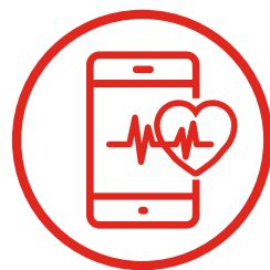
MEJORA DE LA SALUD Y TECNOLOGÍA DIGITAL (E-HEALTH)